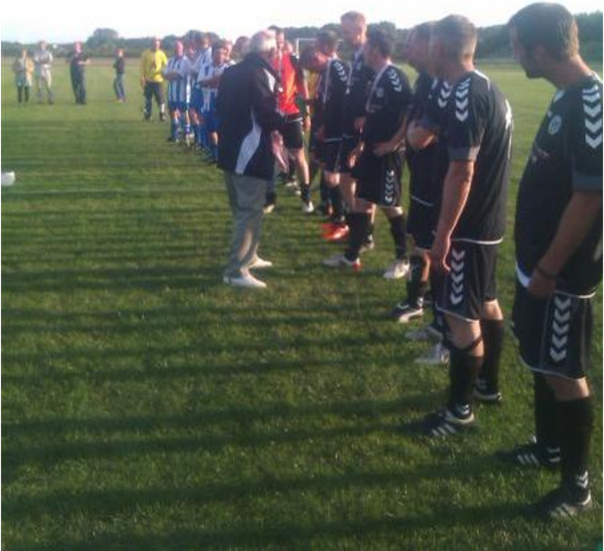
Oldboysholdet modtager sølvmedaljer den 29. juni 2011 efter 0-5 nederlaget til Hareskov

"Den der opgiver at blive bedre - ophører med at være god" FC Midtjylland